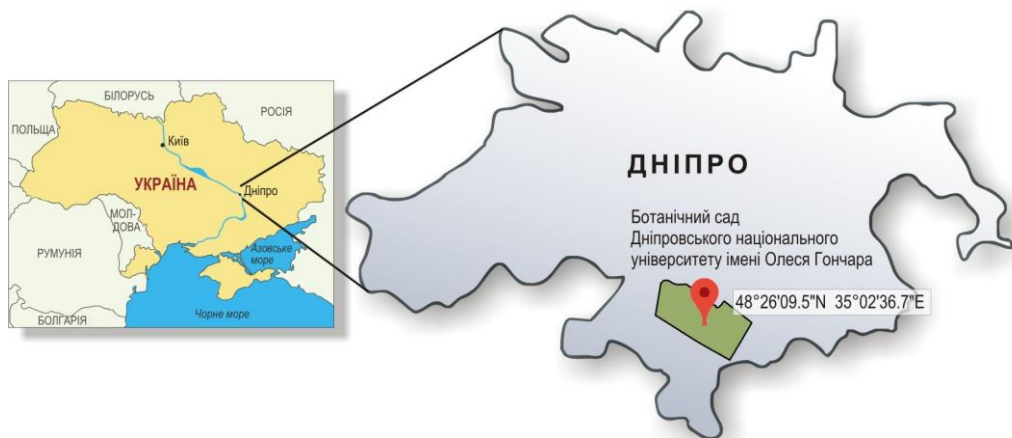
Рис. 1. Розташування ботанічного саду Дніпровського національного університету імені Олесея Гончара на території м. Дніпро

Об'єктами дослідження слугували 2 види і 22 сорти Streptocarpus Lindl., 5 видів і 2 сорти Primulina Hance. Спостереження проводились з 2019-го по 2022 рік в експозиційній оранжереї ботанічного саду ДНУ (рис. 1).